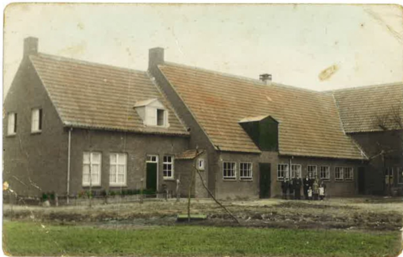
Bij bevrijding 3 november 1944